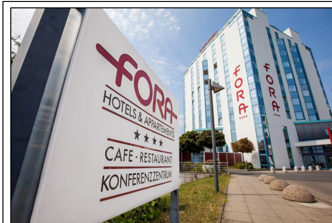
FORA Hotel Hannover