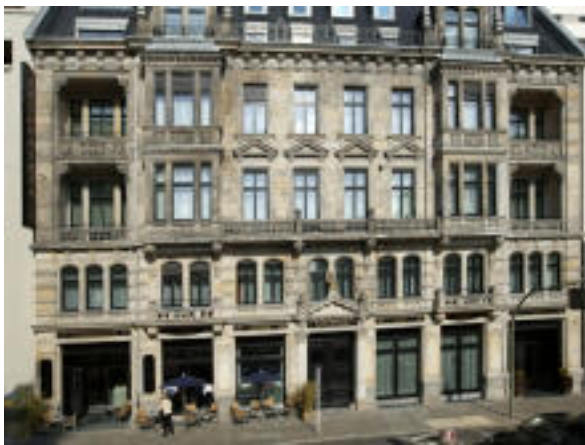
Angletterre Hotel Berlin

11.04.2019 bis 13.04.2019 (Teil 1) 13.06.2019 bis 14.06.2019 (Teil 2) in Berlin