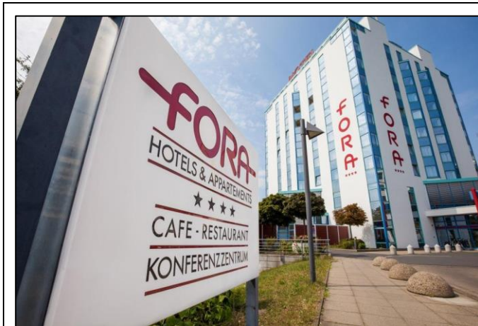
FORA Hotel Hannover